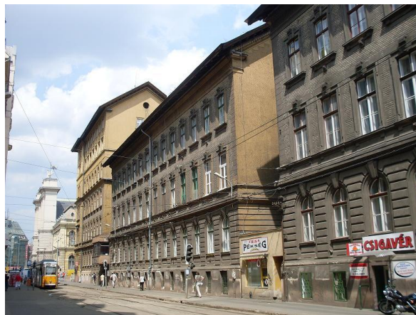
Festetics György utca